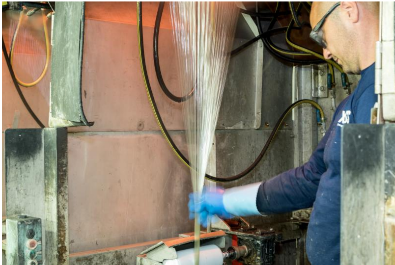
Glasfaserproduktion von LANXESS am Standort Kallo bei Antwerpen, Belgien.